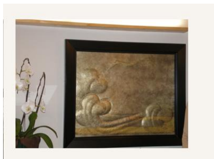
彫金大作「筑波瑞雲」