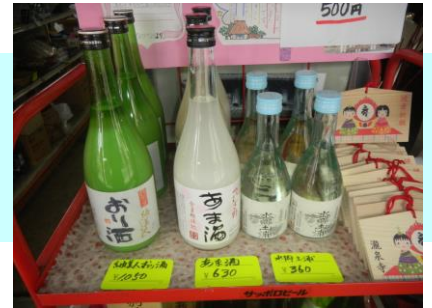
↑まち探検でお店に見学に来た小学生達のお手紙が可愛らしく飾られていました♪

「霧筑波」「蔵のある街」「水郷土浦」 「おり酒」多数ご用意しています。 お土産にぜひどうぞ！