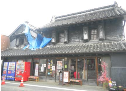
↑震災にも負けない強さ！！