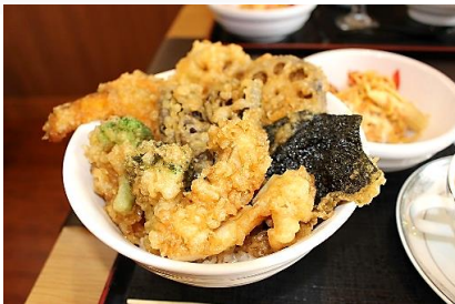
本日の880円ランチ たっぷり野菜の天丼セット

ご宴会などのご予約も承っております。ご予算に応じて対応させていただきますので、お気軽にお問い合わせください。