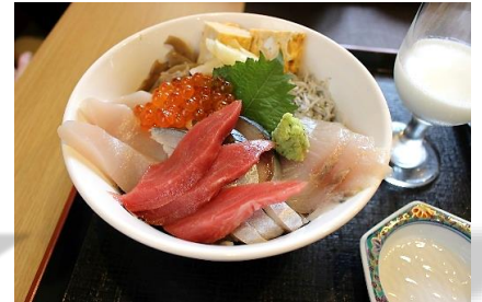
一番人気！！ 海鮮丼 1,200円