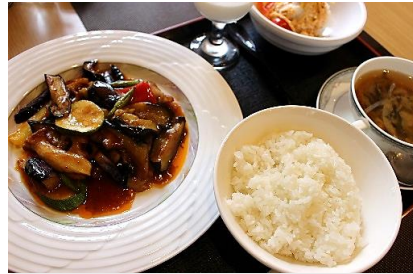
本日の880円ランチ 味麗豚と茄子の四川辛味炒め