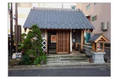
⑤大徳本店前(soraギャラリー)