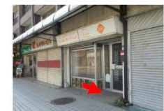
⑥亀屋食堂(脇の空き店舗前)