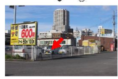
⑬桜川第一橋梁下(駐車場車内)