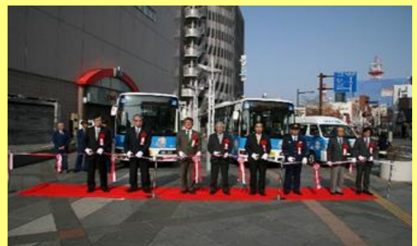
10年前、キララちゃんバス運行開始 記念セレモニーの様子