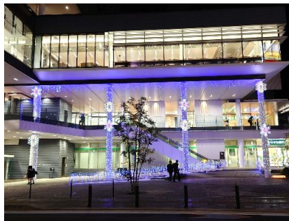
アルカス土浦・市立図書館前