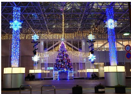
うらら大屋根ひろば